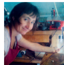
Atelier de fabrication d'archets SOLANGE CHIVAS