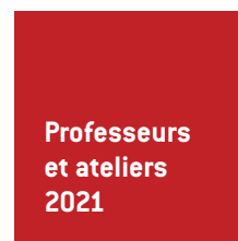
ACADÉMIE MUSICALE OLLANS HORS LES MURS