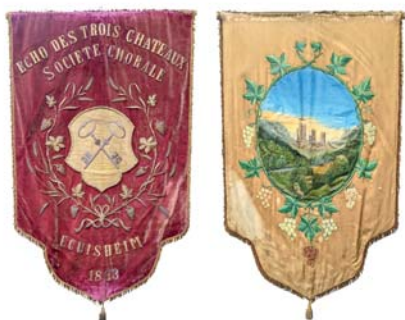
Drapeau remis en 1865