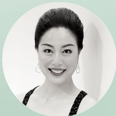
AI WU CHINE